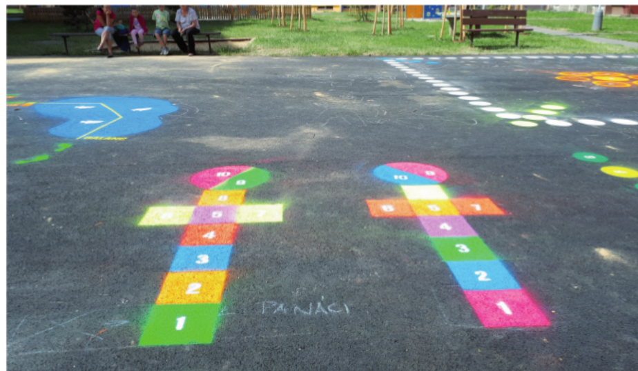
Na snímku ukázka jedné z realizací v Krnově

Pravidla her obec obvykle zveřejní na tabule u hřišť, na webu spolu s interaktivními mapami a seznamem herních míst či ve zpravodaji. Osvědčilo se také propojit otevře-