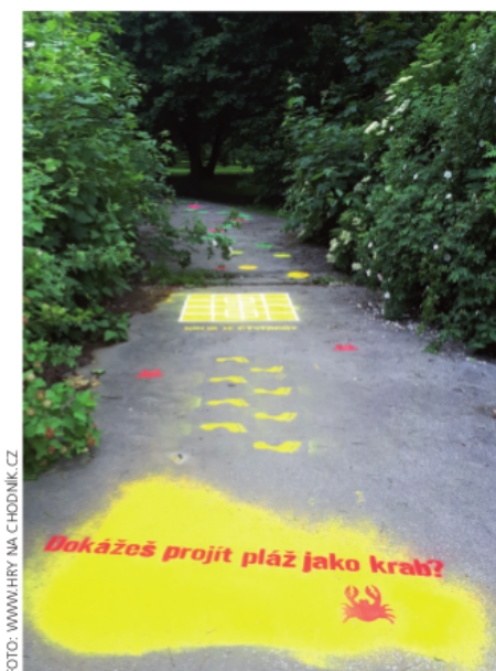
V ostravském městském obvodu Mariánské Hory a Hulvákách vytvořili např. celou herní dráhu s názvem Ostrov pokladů. Ta dovede hráče až k truhle s pokladem

Jak hodnotí barevná hřiště sami zadavatelé? Plánují po prvních zkušenostech jejich rozšíření? Už jsme zmínili, že první hřiště vzniklo v Paskově, konkrétně na nevyužitém prostoru u tamní základní školy. Podle